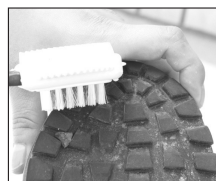
▲ソールの泥や小石を取り除く