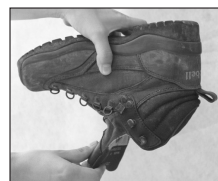
▲靴のなかのゴミも取り除く