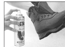
▲SRレザースプレーを吹き付ける

保革・防水用のスプレー(SRレザーシューズスプレー/SRスプレー)やワックスを用いてメンテナンスを行います。スエード/ヌバック(起毛皮革)の場合、スプレータイプの方が風合いを維持できます。(ワックスタイプのものでお手入れを続けると皮表面の色や風合いが変化します。)