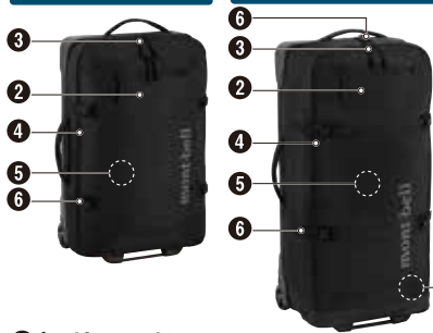
ウィーリーダッフル90