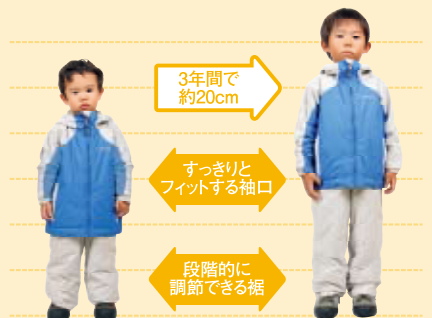
パウダーライトジャケット&ピブ 同サイズ(110)着用時

Jr.&Kid'sサイズの子どもの成長は、3年間に平均で約20cm。その成長に合わせて、約4シーズン使用可能なシステムを採用しました。(特許出願中)