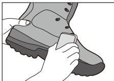
▲靴用ブラシで汚れを落とす

靴用ブラシ等 (ヌバックやスエードの場合は専用ブラシ) を用いて汚れを落とし、頑固な汚れは水洗いしてください。市販の靴専用洗剤で洗うと、皮革パーツの油分を保ったまま汚れだけを落とすことができます。