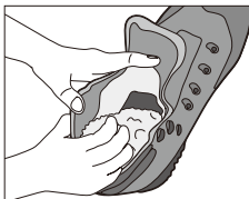
▲靴内部についた泥を落とす

フットベッド (中敷き) は使用するたびに取り出し、しっかり乾燥させてください。また、取り出すことで靴内部も乾かしやすくなります。汚れがひどい時には洗剤とブラシで洗ってください。靴内部のライニングが革であれば、汚れを拭き取って落とし、ファブリック (合成繊維) であれば、ブラッシングで汚れをかき出してください。