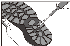
▲つまった石を取り除く