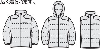
ジャケット男性用 パーカー男性用 ヴェスト男性用