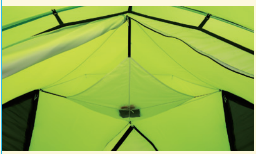
※写真はイメージです。 *Illustration. Actual product may vary.