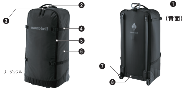
※写真はウィーリーダッフル 80です。